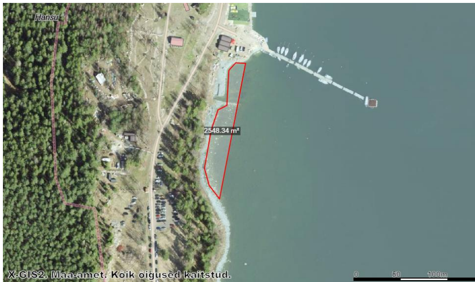
Joonis 3. Täiteala.

Täiteala hakatakse kasutama kalurite alana (mõrdade püügivalmiseseadmine ja remont, paatide hoiustamine), mille osas on sadamas suur nõudlus. Alale hooneid või muid rajatisi ei planeerita. Ala täidab ka purjetamisega seotud eesmärgid, aitab võistluseid läbi viia, viimastel aastatel on osalejate hulk suurenenud ja platsi vajadus suurenenud. Puhke eesmärgid sadam lahendab teistes kohtades. Arvestades kalurite arvu, püügilube, mõrdade eripära ning kalapaatide arvu, siis on loodav ala piisav rohkem kui kümneks aastaks. Ei ole ette näha uusi laiendamisevajadusi. Paadihoiukohad on seotud kogu sadama võimekusega ja veel suurema ala kasutusele võtt vajaks kogu sadama renoveerimist. Planeeritud ala oleks optimaalne ja tekib loogiline tervik.