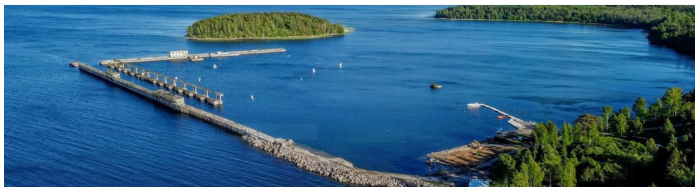
Joonis 1. Hara sadam.

Keskkonnavaluba taotletakse Hara sadama (Hara sadam, Hara küla, Kuusalu vald, Harju maakond, kü 42301:001:0292) akvatooriumi süvendamiseks mahus 3 840 m 3 . Süvenduspinnas soovitakse paigutada sadam akvatooriumi piiresse jäävale madalale merealale sadamaala kujundamise eesmärgil. Täiteala korrastamiseks kaetakse ala veel eraldi täitematerjaliga (muld, liiv) mahus 2 850 m 3 . Tegevuse käigus muutub rannajoon. Keskkonnavaluba taotletakse kehtivusega kaheksa aastat.